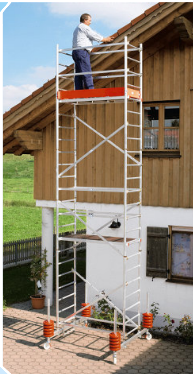
Módulos A + B + C + D