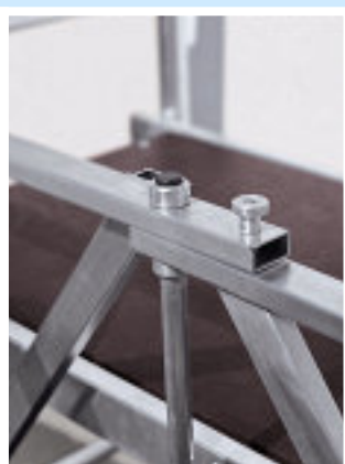
Bisagra del módulo plegable