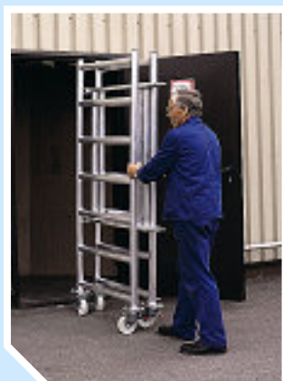
Módulo plegable, K