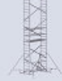
Módulo K + B + C + D