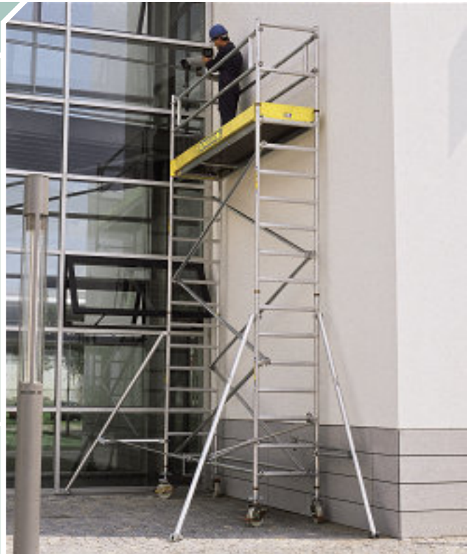
Medida de plataforma