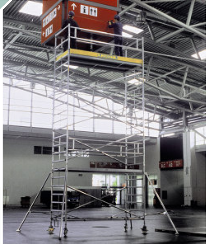
Medida de plataforma