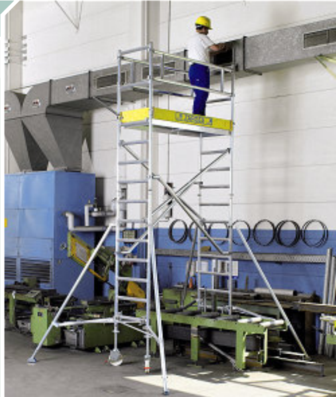
Medida de plataforma