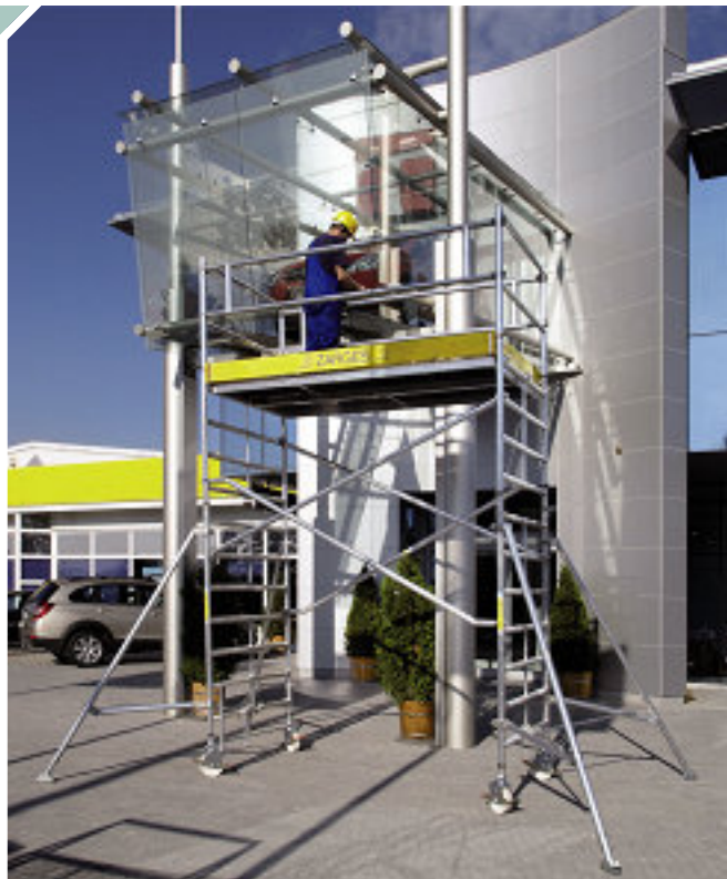
Medida de plataforma